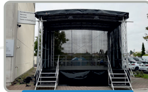
AL Stage R24