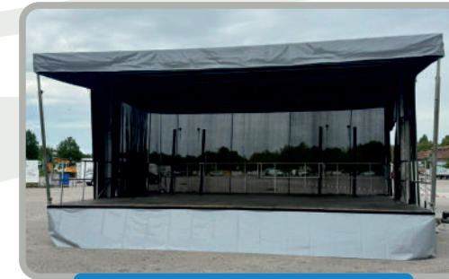
Europodium Willy 48